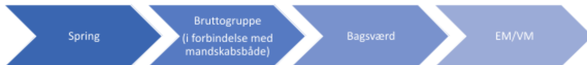
Figur 4 – Proces i forbindelse med udtagelse i "øvrige" discipliner

Atleter og mandskaber konkurrerende i "øvrige" discipliner kan udtages til EM/VM ved at sandsynliggøre et top-5 resultat i international sammenhæng. I forbindelse med udtagelse i K1/C1 discipliner lægges der størst vægt på Bagsværdregatta.