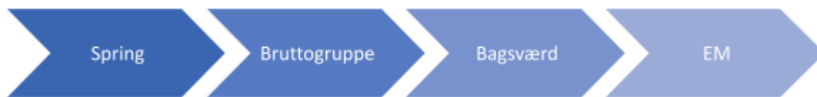
Figur 3 – Proces i forbindelse med udtagelse til EM

Atleter udtaget til VM prioriteres i første omgang til at deltage ved EM. Dog tages atleter, der er udtaget til VM bruttogruppen, men ikke blev udtaget til VM, i betragtning til EM. Det betyder, at EM kan bestå af et delvist nyt hold sammenlignet med VM.