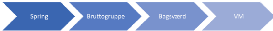
Figur 2 – Proces i forbindelse med udtagelse til K2/C2 500 m. og K4 500 m.

Selektionen til de enkelte mandskabsbåde vil således foregå på samme måde som vi kender det fra fodbold, håndbold og andre holdsportsgrene.